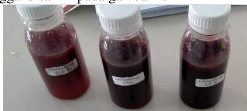
Gambar 1. Formula Sirup Liofilisat Buah Harendong ( Mellastoma affine D. Don) Konsentrasi 0,5%; 1%; 1,5%

diformulasikan ke dalam sediaan sirup. Pembuatan sediaan sirup liofilisat buah harendong ini menggunakan sukrosa dengan kadar 60%, hal ini sesuai dengan literatur pada FI III, 1979 yang menyatakan bahwa dalam sediaan cair berupa larutan (sirup) mengandung sukrosa dengan kadar tidak kurang dari 60% dan tidak lebih dari 66,0%. Sirup liofilisat buah harendong dibuat 3 formula yaitu konsentrasi ekstrak liofilisat buah harendong 0,5%, 1% dan 1,5%. Formula sirup liofilisat buah harendong konsentrasi 0,5%; 1% dan 1,5% dapat dilihat pada gambar 1.